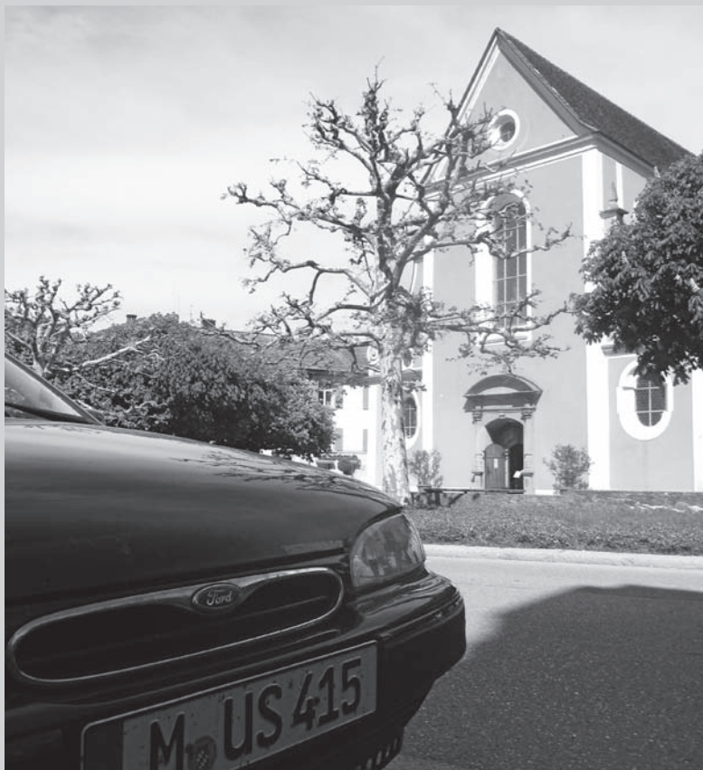
Ein Münchner Musiker in Bad Zurzach im April 2012. Konzert im Verenamünster auf Stimmtonhöhe a' = 415 Hz.